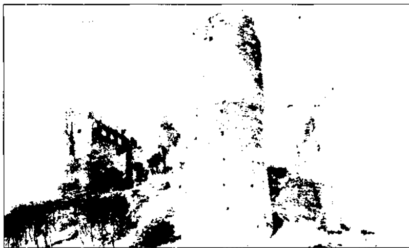
Castell de la Roca.

No és un descobriment espectacular, sens dubte, pero pensem que contribueix a conèixer millor el procés de compra de la jurisdicció reial. Esperant un treball definitiu sobre aquest procés, en aquest paper només presentarem alguns aspectes que serveixin de context històric on el document sigui més comprensible.