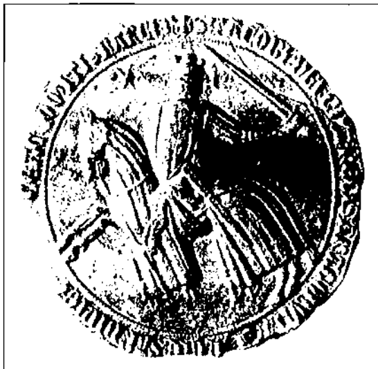
Segell de Jaume II d'Aragó de l'any 1317

Acabem. Un estudi complet hauria d'aprofundir més les qüestions que aquí només hem apuntat. Tanmateix, queda establert el context històric on cal inscriure el document i la qüestió dels canvis de jurisdicció: la percepció de la renda feudal pels «senyors» va generar més riquesa de la que podia gastar la classe