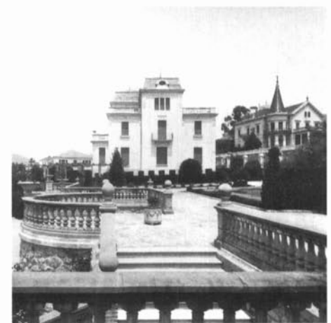
Façana sud i jardí de la casa anomenada La Caritat, a la sisena «mansana Raspall», edificada l'any 1916. En primer terme veiem les balustrades i l'escala del jardí. En segon terme, al costat dret, es veu la casa de Josep Suñol, bastida l'any 1906 segons projecte de l'arquitecte Emili Sala i Cortés.

D'aquesta lectura es dedueix que s'ha de protegir el que resta del conjunt de les sis «mansanes Raspall» i que s'ha de controlar tota intervenció en el conjunt, ja que són edificis o conjunts molt representatius d'un moment àlgid de la història urbana de la Garriga.