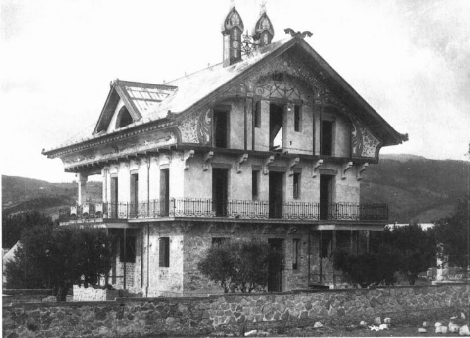
Cantonada sud-est de la casa del Parc Serra, edificada l'any 1909; inacabada i transformada en la dècada dels anys 40.

tada pels carrers del Figueral, el Passeig, de Caselles i de Manuel Raspall, i la constitueixen quatre edificis singulars bastits en el quadrienni de 1910-1913. Es tracta d'un conjunt únic en la història de l'arquitectura modernista catalana, ja que consta de quatre edificis aïllats, situats a la mateixa «mansana» i bastits en un període curt de temps (1910-1913), i són molt representatius del llenguatge modernista de la primera etapa en què es pot dividir l'obra de Raspall. Per la seva situació, el conjunt constitueix una fita arquitectònica important dins el paisatge urbà. Està situada estratègicament a l'entrada del llarg passeig de plàtans, on també hi ha la segona i la tercera «mansana Raspall».