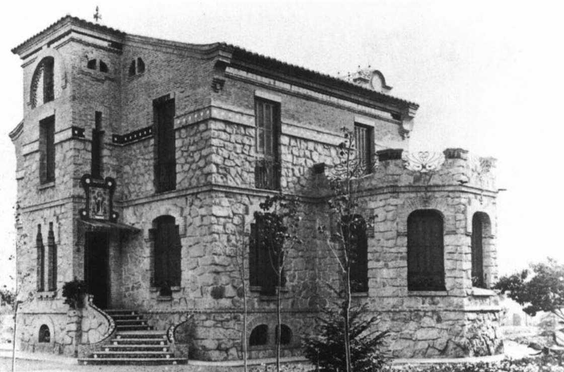
Cantonada nord-est de la Torre Sant Josep, situada a la primera «mansana Raspall». La fotografia és del final dels anys 10 i ha estat cedida a l'arxiu Cuspinera per la família Mates.

Es tracta d'un conjunt interessant edificat entre els anys 1906 i 1910. A la casa Llorenç hi trobem, per primera i única vegada en l'obra de Manuel Raspall, el paredat comú sense revestir als murs de la façana i el dintell de totxo vist escalonat als buits de finestres i balconeres. La «mansana» conserva la seva imatge original. Actualment és la segona «mansana» Raspall en importància arquitectònica i urbanística.