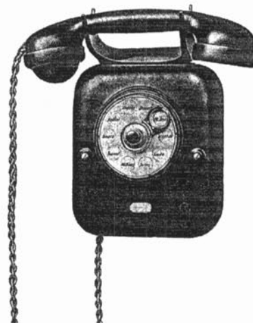
Aparell telefònic selector de paret Siemens & Halske AG (Berlín).