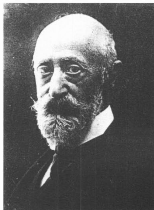
Apel·les Mestres, autor de La viola d'or , va estar estretament lligat al Teatre de la Natura.