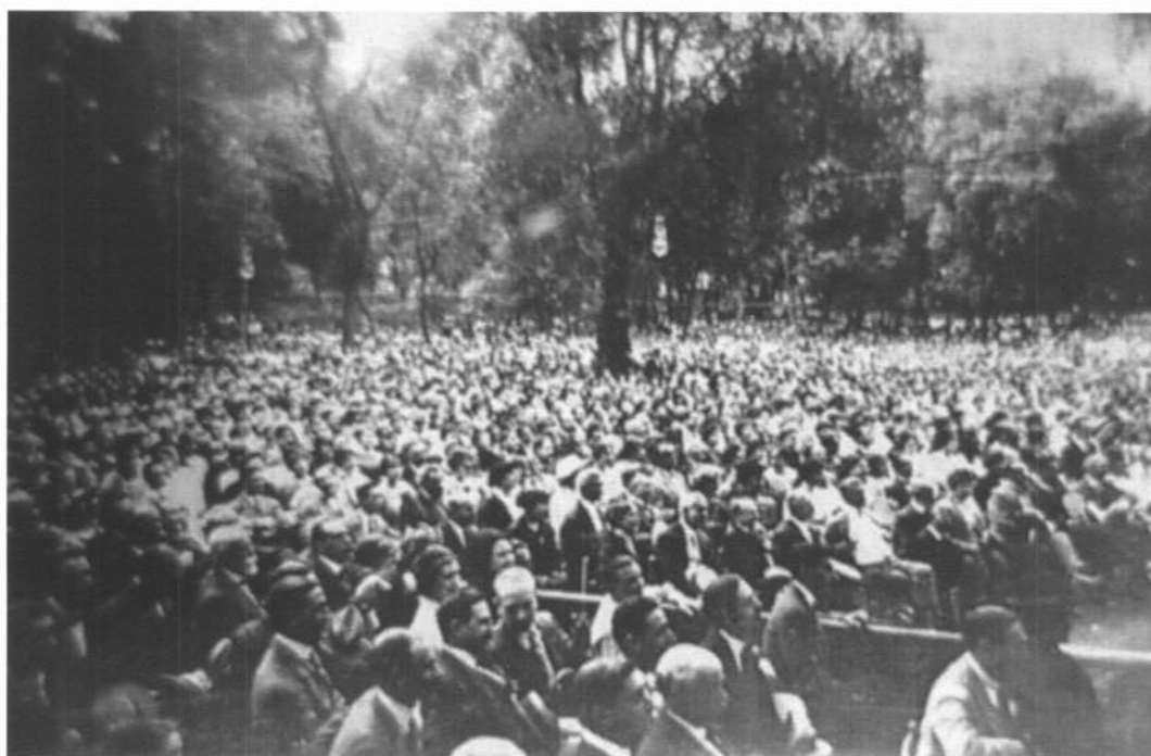
Públic assistent a l'estrena de La viola d'or , d'Apel·les Mestres. (Font: Arxiu Cuspinera).

Per les ressenyes dels diaris i de les revistes de l'època sabem que no es va escatimar cap detall perquè cada festa del Teatre de la Natura fos un èxit. Es va tenir una cura especial amb la premsa, a la qual invitaven prèviament per a reconèixer l'espai teatral. Abans i després de les representacions, els anuncis i els comunicats als diaris eren abundants. Hi havia una ferma voluntat que aquests actes fossin transcendents per al país i de màxima concurrència.