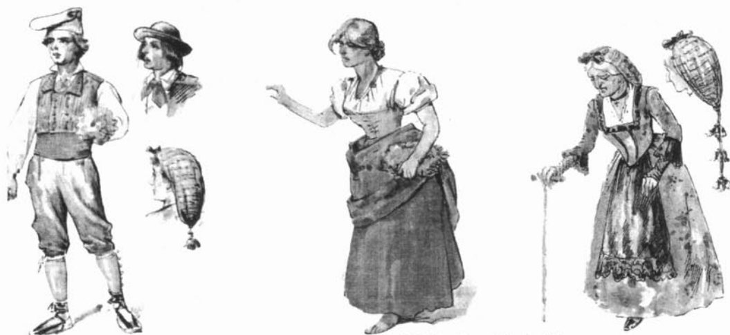
Apel·les Mestres: figurins per a Flors del cingle , d'I. Iglésias. Teatre Eldorado, 1912