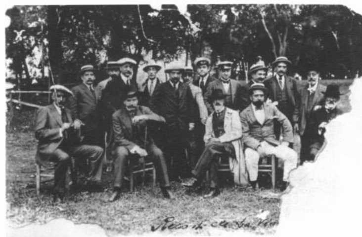
Els organitzadors.